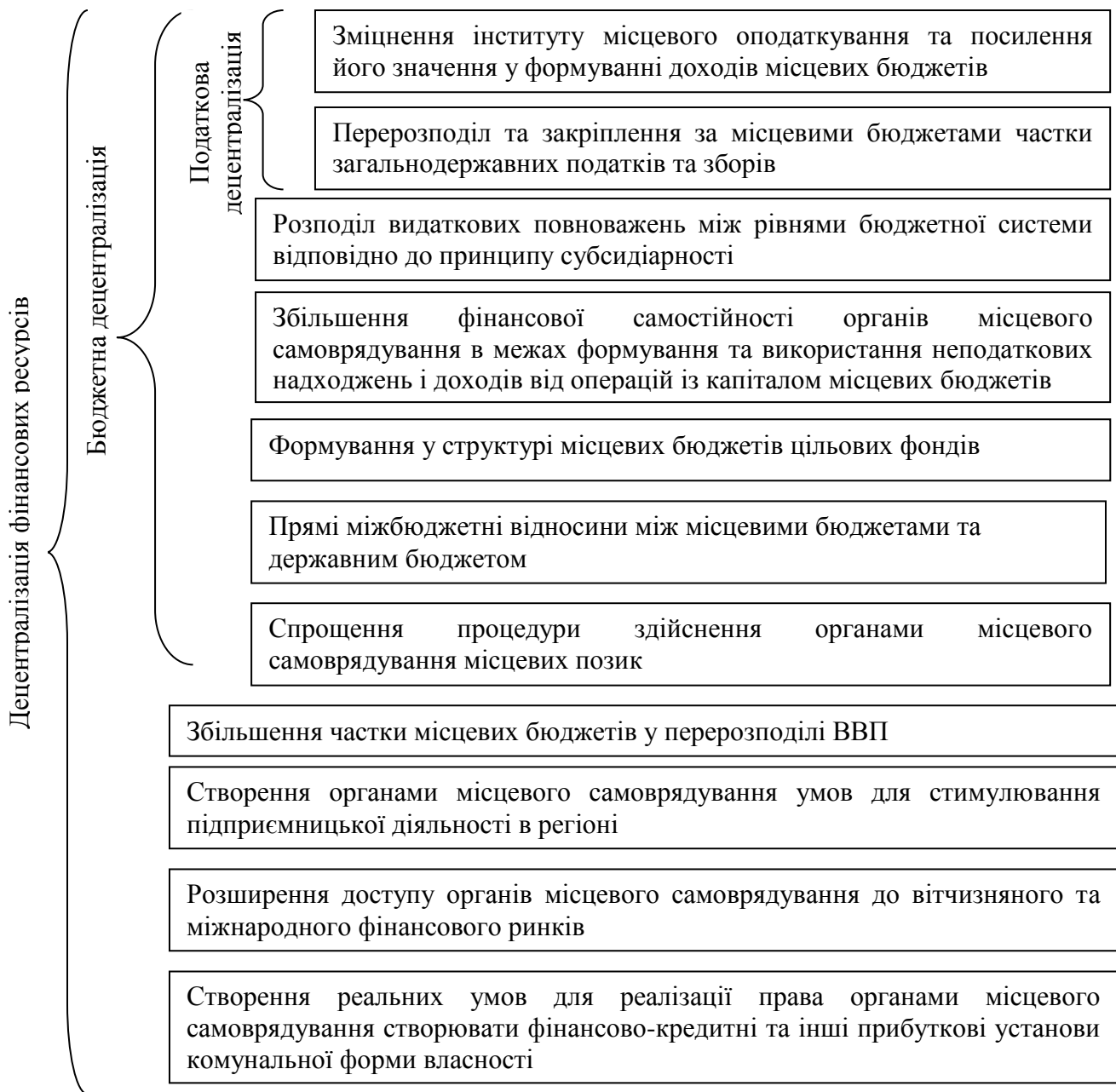
Рис. 1. Взаємозв'язок структурних складових децентралізації фінансових ресурсів та їх основні характеристики

доведено, що децентралізація фінансових ресурсів є більш широким поняттям, яке включає бюджетну децентралізацію, яка, у свою чергу, включає податкову децентралізацію (рис. 1).