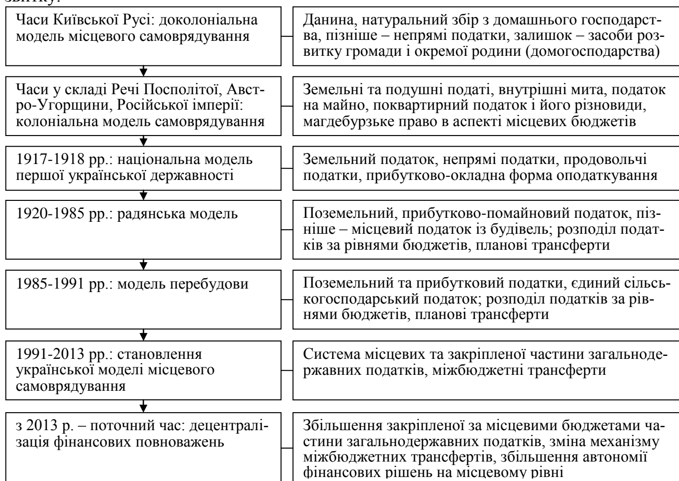
Рис. 2. Інструменти податково-бюджетної політики в Україні за етапами становлення місцевого самоврядування

В історичній ретроспективі використання інструментів податково-бюджетної політики місцевого розвитку в Україні здійснювалося в рамках базових етапів становлення місцевого самоврядування, які можна охарактеризувати у рамках окремих національних моделей, що представлено на рис. 2. Як можна побачити з наведених даних використання інструментів податково-бюджетної політики не відповідало і навіть за сучасних умов продовжує не відповідати потребам забезпечення місцевого розвитку.