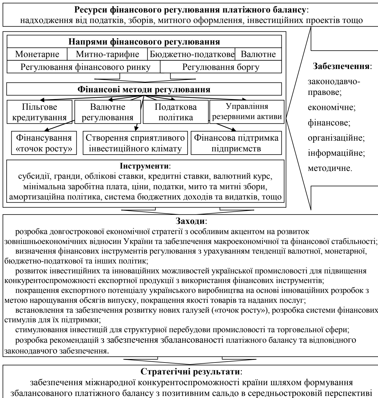
Рис. 4. Фінансовий механізму регулювання платіжного балансу

та інструментів і знаходить безпосереднє практичне втілення у діяльності суб'єктів регулювання платіжного балансу.