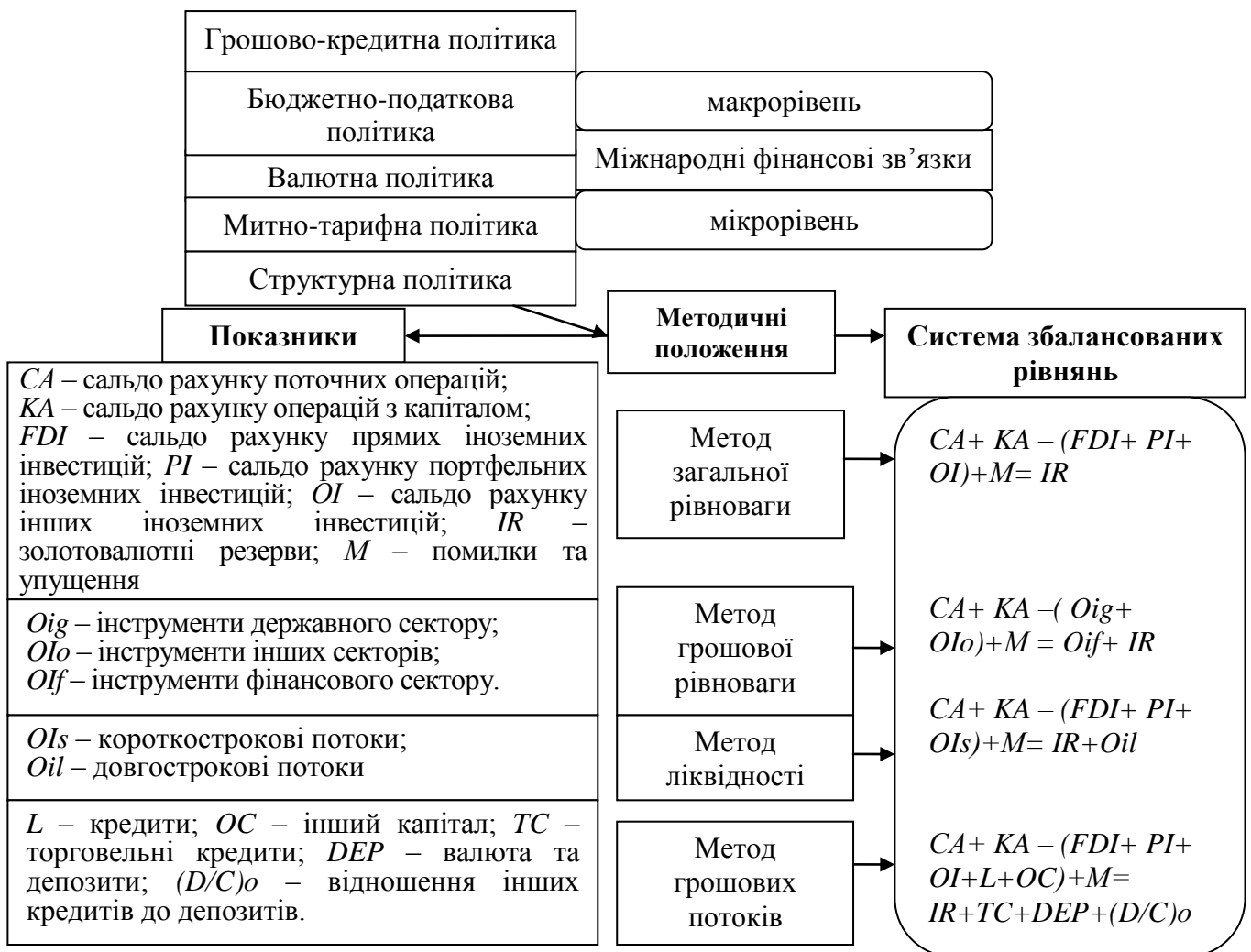
Рис. 3. Методичні положення оцінки збалансованості платіжного балансу

Виявлено, що для комплексної оцінки ефективності проведення політики регулювання платіжного балансу та використання інструментів, стимулів та методів за допомогою організаційного, нормативно-правового та інформаційного забезпечення необхідним є удосконалення методичних положень оцінки збалансованості платіжного балансу. Відповідно до структурної побудови платіжного балансу запропоновано комплексну оцінку, що дало змогу оцінити основні індикатори, які відображають ефективність державної політики регулювання платіжного балансу (рис. 3).