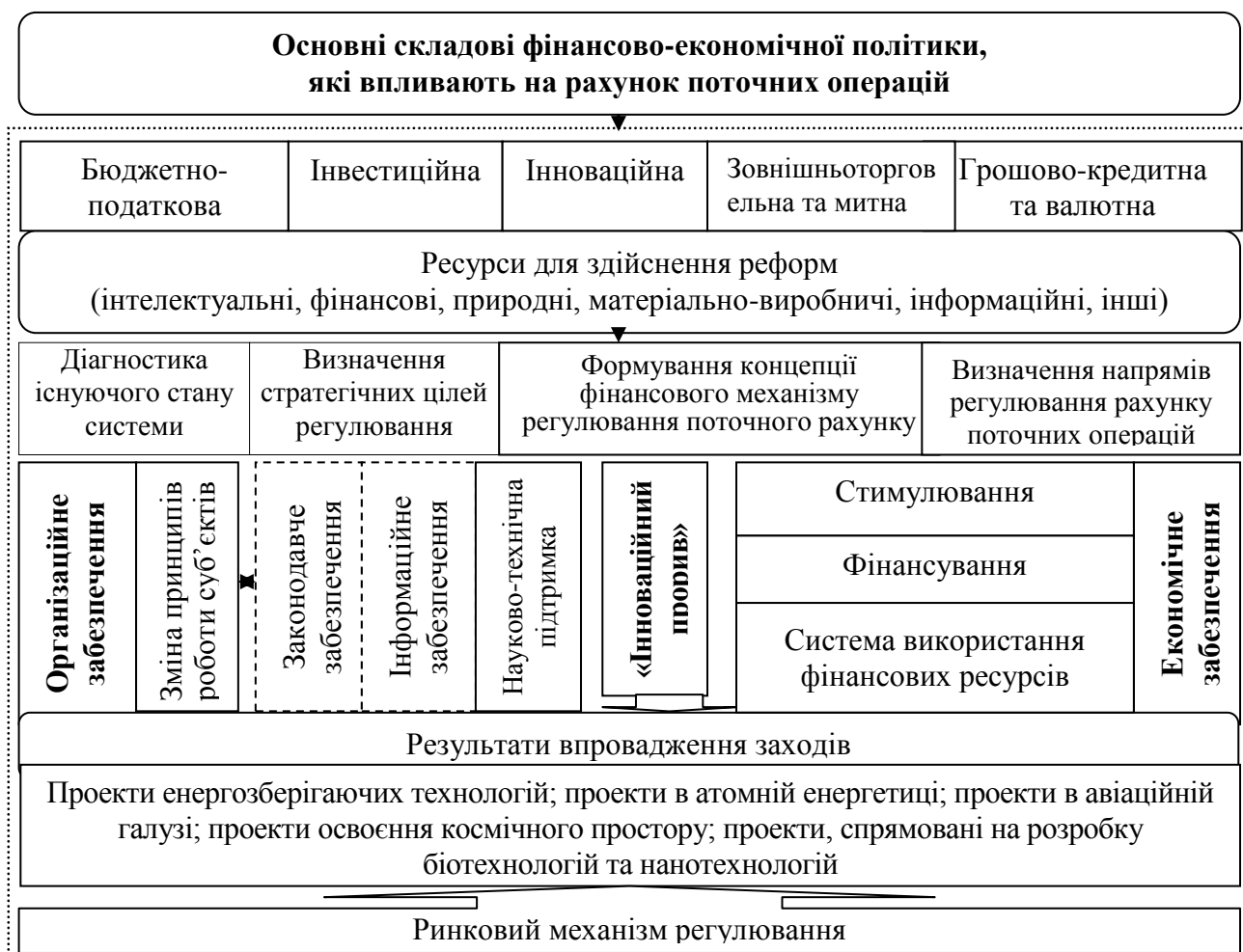
Рис. 5. Система організаційно-економічного забезпечення регулювання рахунку поточних операцій платіжного балансу