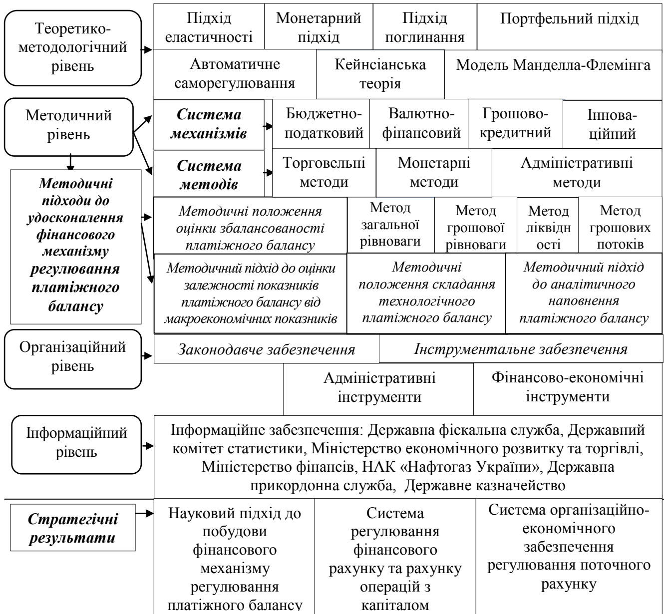
Рис. 1. Концептуальні положення розвитку фінансового механізму регулювання платіжного балансу

економічної політики. Аналіз ключових підходів, теорій, механізмів дав можливість визначити концептуальні положення розвитку фінансового механізму регулювання платіжного балансу, що отримані із запропонованої логіки зв'язків предметно-об'єктної області регулювання платіжного балансу (рис. 1).