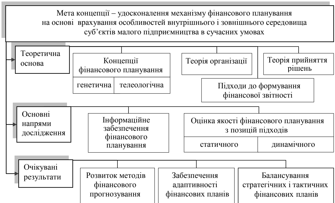
Рис. 1. Концепція вдосконалення механізму фінансового планування СМП

Для подолання встановлених недоліків і забезпечення адекватності СМП умовам внутрішнього і зовнішнього середовища обґрунтовано концепцію вдосконалення механізму фінансового планування СМП (рис. 1), що базується на генетичній і телеологічній концепціях фінансового планування, теоріях організації і прийняття рішень, статичному і динамічному підходах до формування фінансової звітності.