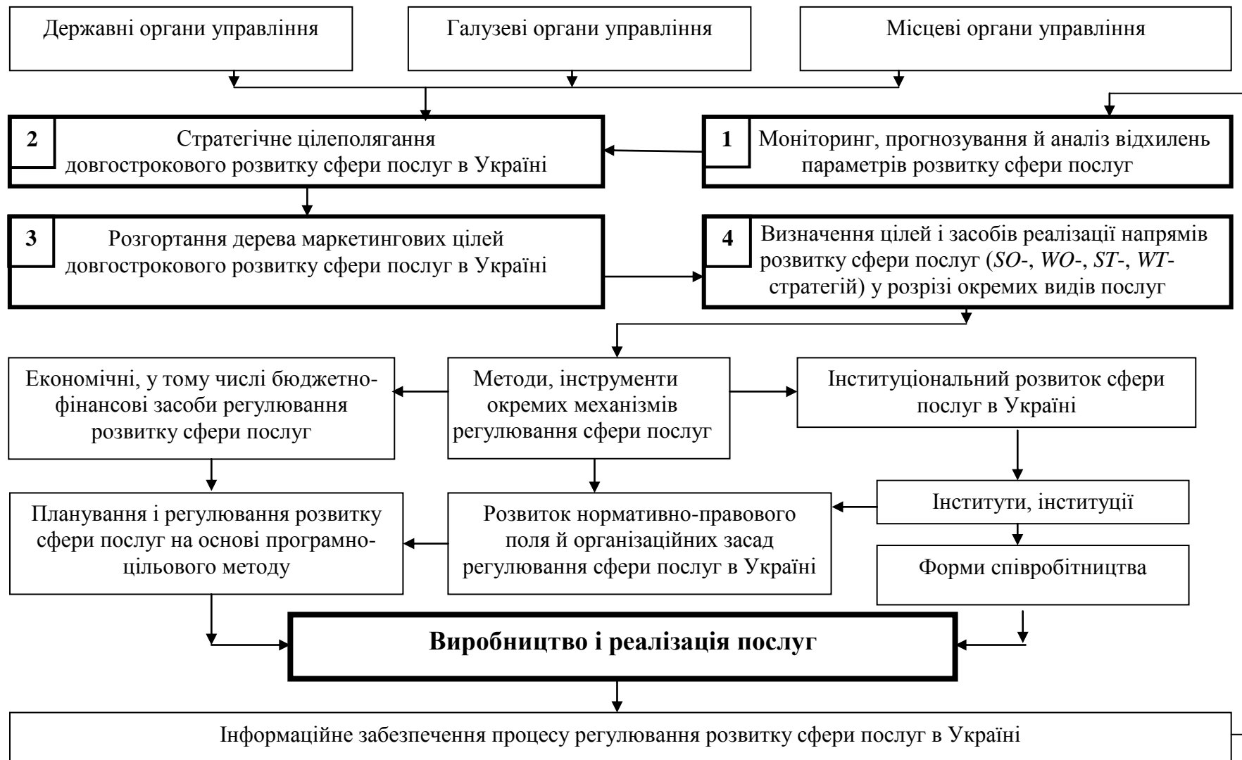
Рис.1. Механізм регулювання розвитку сфери послуг на засадах маркетингу