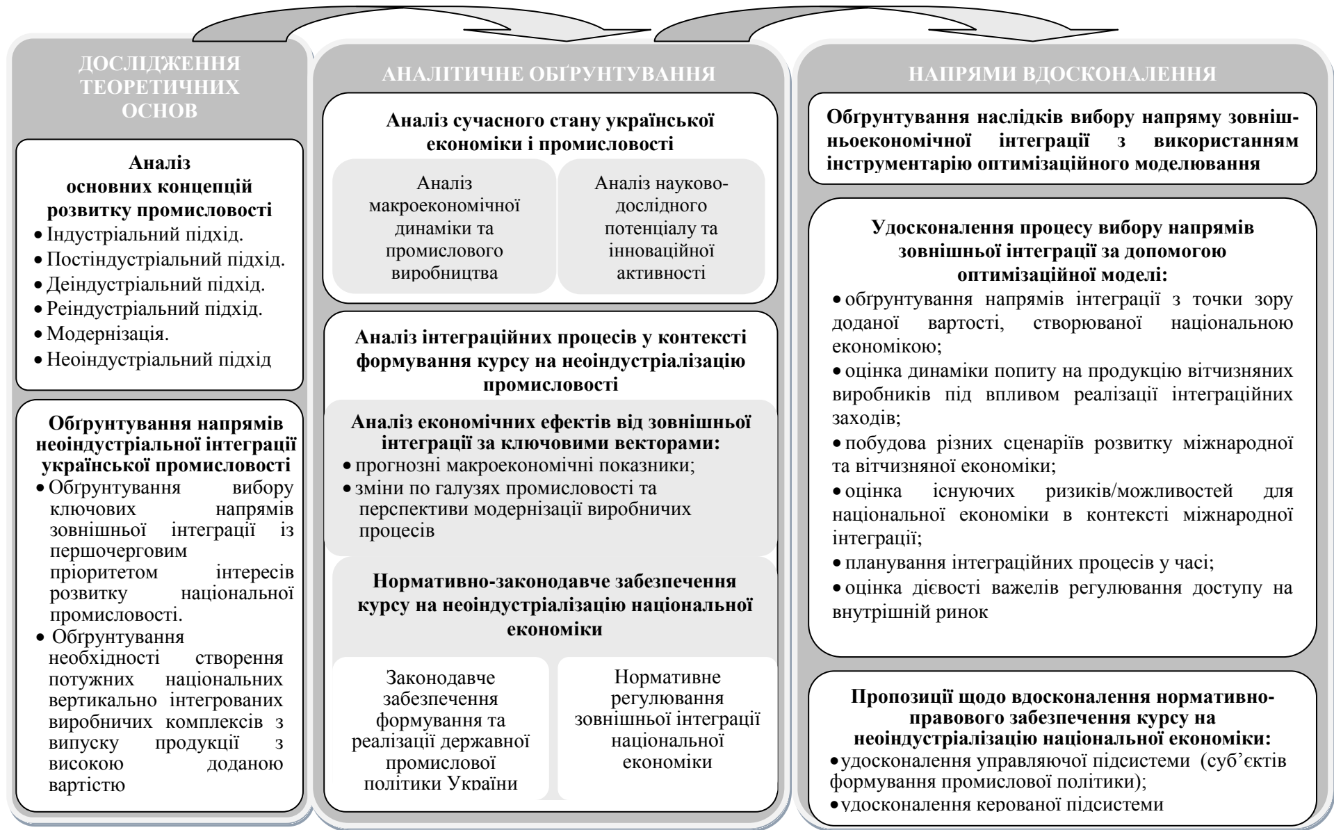
Рис. 1. Концептуальні положення щодо неоіндустріалізації національної економіки в рамках світових інтеграційних процесів